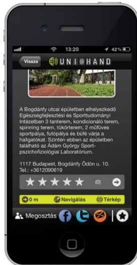
4. ábra. Egy helyszín adatlapja

Az Események menüpont többszintű, tematikus eseményajánlót tartalmaz a az egyetemi rendezvények és helyszínek bemutatásával. Az alkalmazás segítségével emlékeztető értesítés állítható be az egyes események kezdete előtt. Szeretnénk a funkciót úgy továbbfejleszteni, hogy az emlékeztető bekerüljön a felhasználó naptárjába.