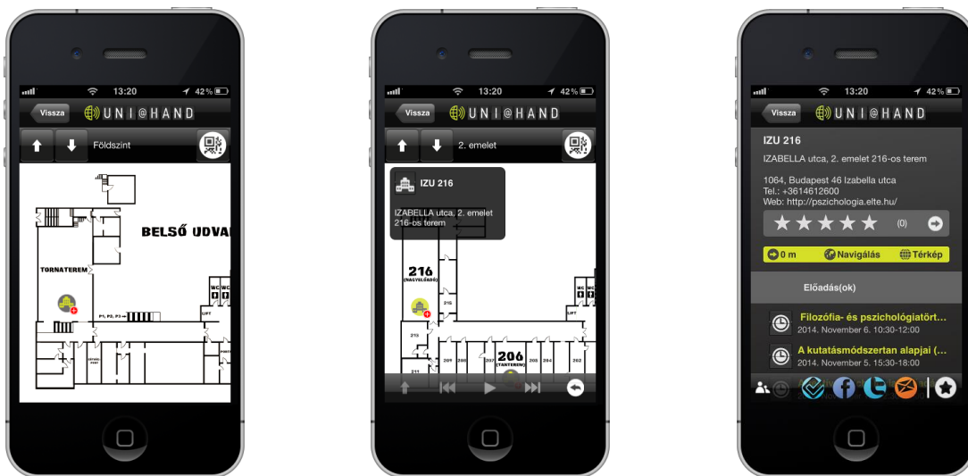
3. ábra. Belső térkép, terem infó panel és egy terem adatlapja

Újdonság a GUIDE@HAND családon belül, hogy a rendszer képes épületek belső térképeit is kezelni. Többszintes épületek esetén a térkép bemutatja az egyes szinteket. Különböző interaktív funkciók tartoznak a belső térképekhez, többek között szintváltás és kicsinyítés-nagyítás. Lehetőség van az épület egyes termeinek a kiválasztására, és a termekhez tartozó közvetlen tartalmak megtekintésére is. Tantermek esetén ebbe az is beletartozik, hogy mikor milyen előadásokat tartanak ott. Az épületben kihelyezett QR kódok segítségével lehet segíteni a térképen való eligazodást. A belső térképek kezelését folyamatosan tovább bővítjük, hamarosan elérhető lesz az útvonaltervezés funkció is, épületen belül, akár különböző szintek között.