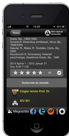
2. ábra. Egy kurzus adatlapja

A Kurzusok menüpont áttekintést nyújt az ELTE PPK alapképzés szintű tantárgyairól. Egy listát jelenít meg, amiből egy tantárgyat kiválasztva, arról részletes információk jeleníthetők